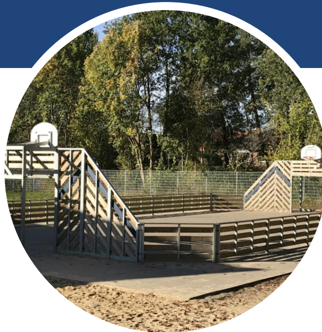
Multifunktionsfeld für Sport, Ganztag und Pausen